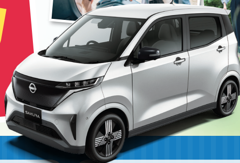
日産サクラ G (パール色)