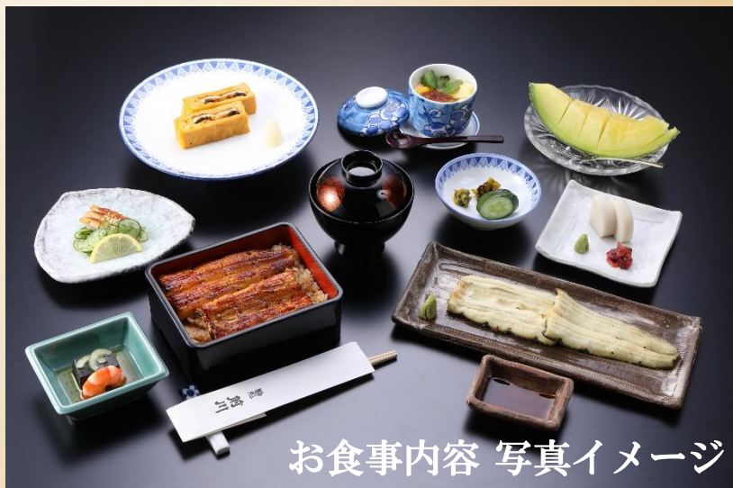
お食事内容 写真イメージ